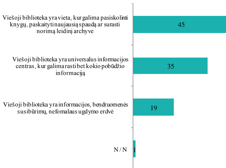
2.1 pav. Nuostatas apie viešąją biblioteką geriausiai atitinkantys teiginiai (proc.; N = 1009)

Nuomonės, kad viešoji biblioteka yra vieta, kur galima pasiskolinti knygų, pasiskaityti naujausią spaudą ar surasti norimą leidinį archyve, dažniau laikosi moterys, vyriausio amžiaus (56 m. ir daugiau) tyrimo dalyviai, žemiausio išsimokslinimo atstovai, mažas ir vidutines pajamas (iki 300 Eur) turintys respondentai, mažesnių miestų / rajonų centrų gyventojai. Universalium informacijos centru viešąją biblioteką dažniau laiko vyrai, 18-25 m. respondentai, didžiausias pajamas (virš 500 Eur) turintys apklaustieji bei miestiečiai. Kaimo vietovių gyventojai dažniau nurodė, kad viešoji biblioteka yra informacijos, bendruomenės susibūrimų, neformalaus ugdymo erdvė.